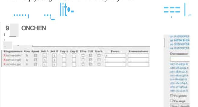
Figur 4: Duerne anmeldes til den enkelte kapflyvningskode fra "bestandlisten" til højre ved et enkelt klik. Sportsduer, spil m.v. kan ligeledes markeres. Med hensyn til bestandlisten er det muligt under punktet "Duebestand" at slette duer, som måske er mistet eller ikke flyves med for at øge overskueligheden ved anmeldelsen.