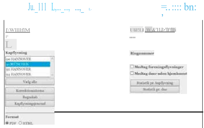
Figur 5: Anmeldelser (korrektionsskemaer) udskrives under fanen "Rapporter", hvor man kan vælge ugenummer og flyvning. Det er også muligt at udskrive regnskab og kapflyvningsjournal.