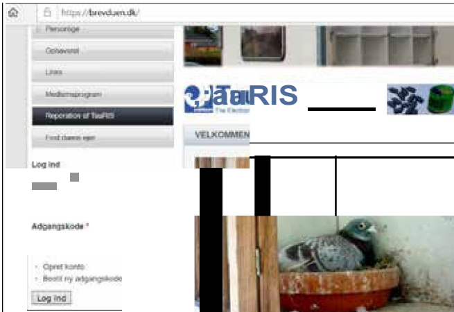
Figur 1: Man logger på med personligt brugernavn og adgangskode på www.brevduen.dk .

I illustrationerne kan man se de enkelte trin i betjeningen af medlemsprogrammet, og hvordan programmet ser ud med hensyn til brugervenligheden.